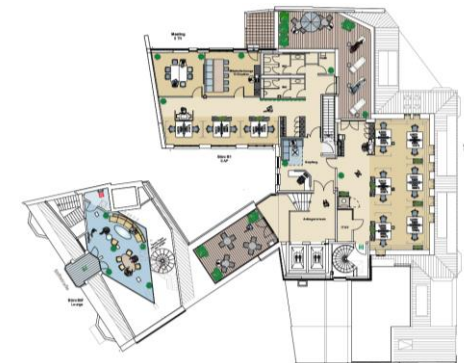
6. Obergeschoss | Musterplanung