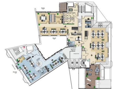
5. Obergeschoss | Musterplanung