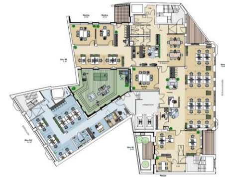
1. Obergeschoss | Musterplanung

Stiftstraße 8-10, Brönnnerstraße 5-9 60313 Frankfurt am Main