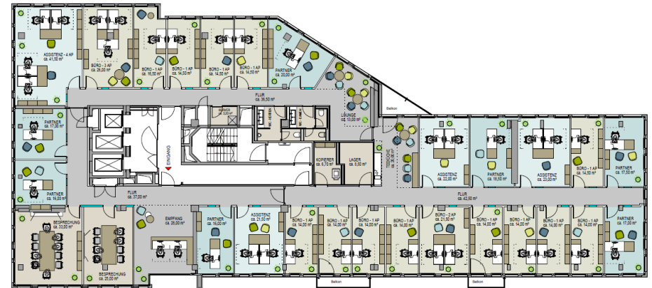
1. Obergeschoss | Musterplanung