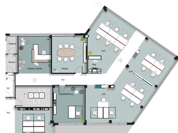
Regelgeschoss | Musterplanung | Mietbereich MB 2