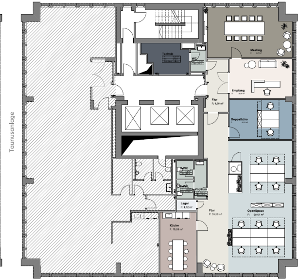
Mainzer Landstrasse Regelgeschoss I Bestand 5. OG