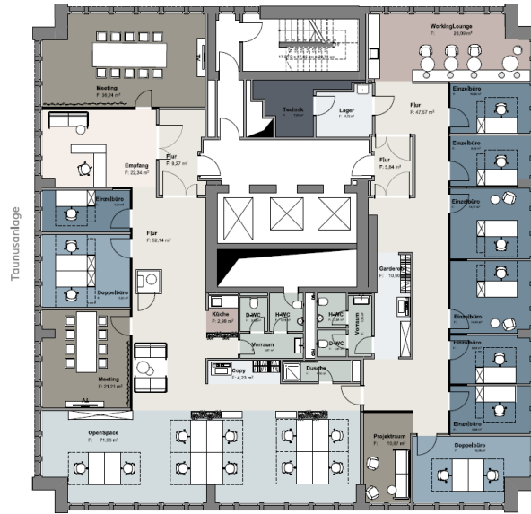
Mainzer Landstrasse Regelgeschoss I Musterplanung 4. OG