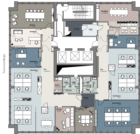
Mainzer Landstrasse Regelgeschoss I Bestand 4. OG